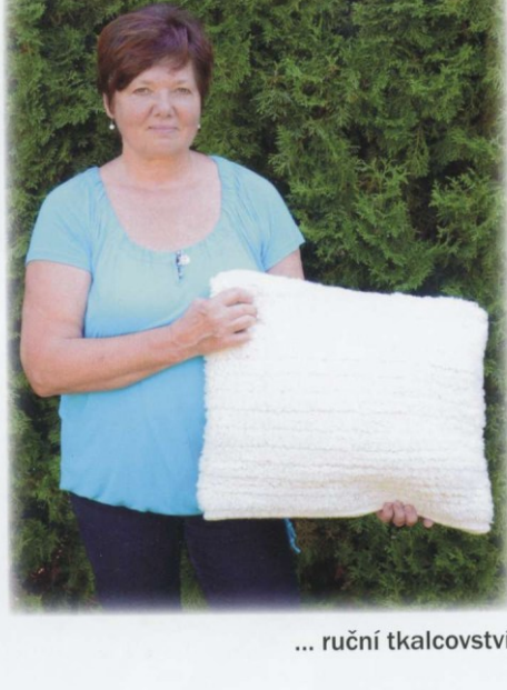
... ruční tkalcovství